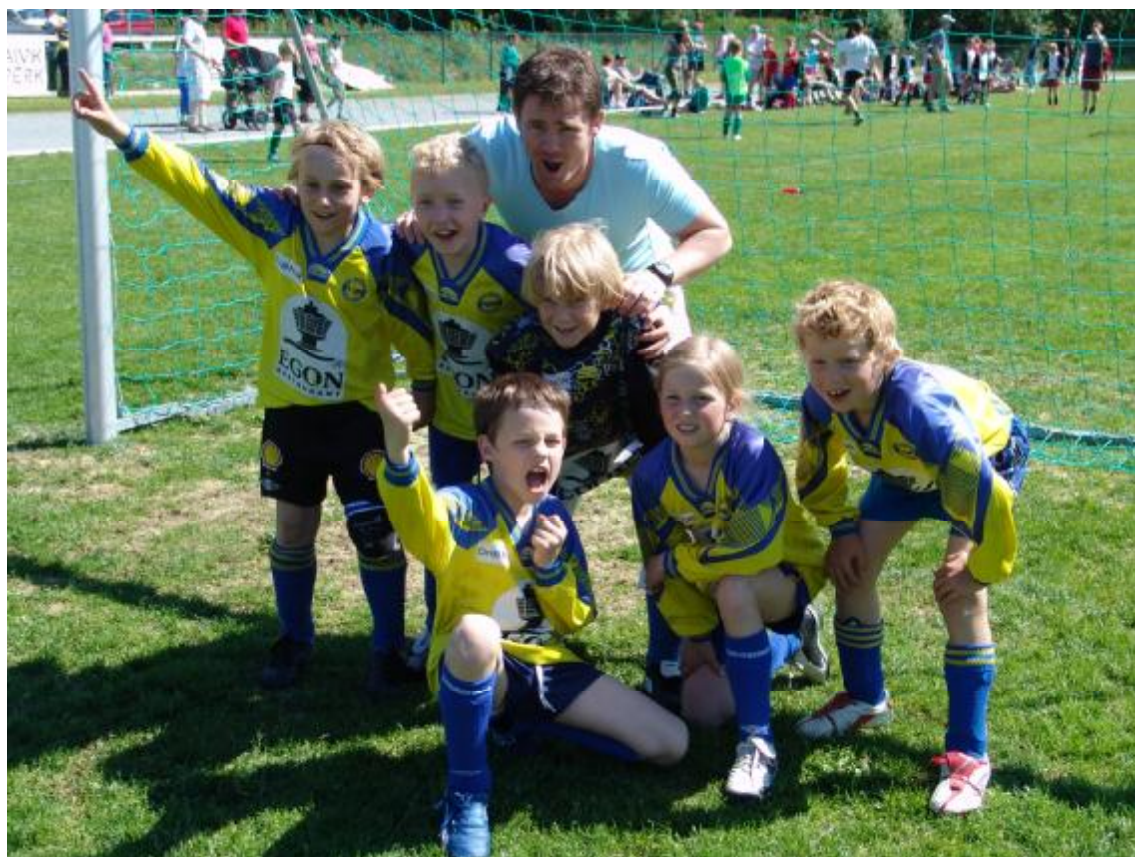
Ett av 7 Strindheim MG-97 lag som deltok under årets Vika Cup i Hommelvik.